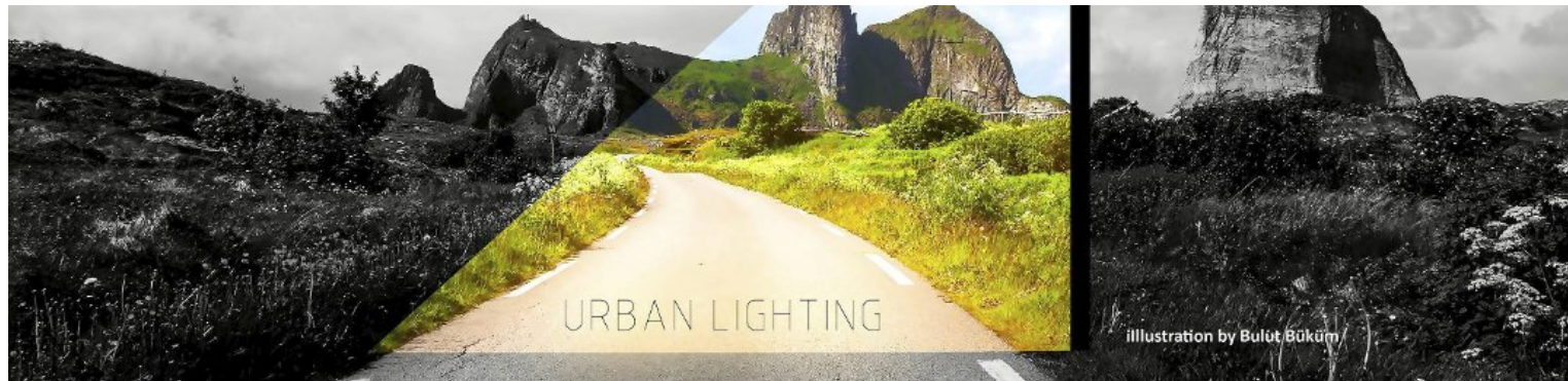
Træna Urban Lighting: Illustrasjon Bulut Bukum, Osram